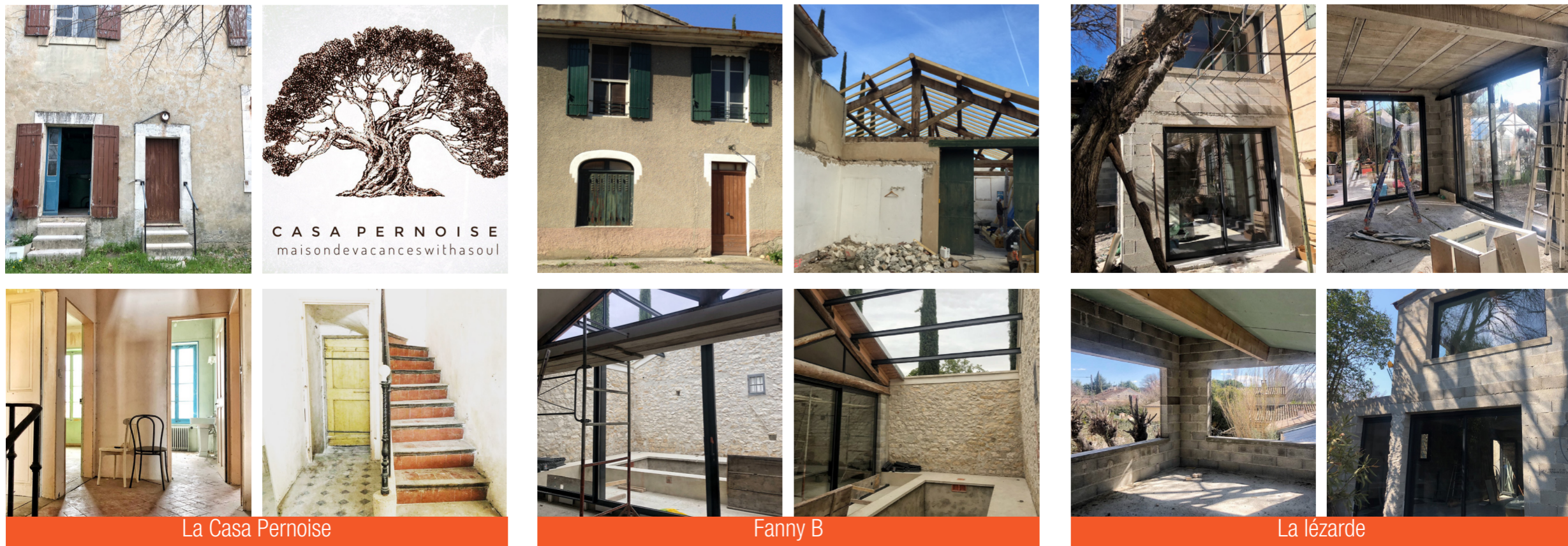
La Casa Pernoise

Et bien entendu, nous vous donnons rendez-vous très bientôt pour visiter ces demeures inspirantes une fois terminées !